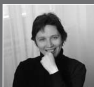
di Sara Caviglia