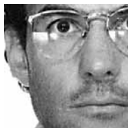
di Marco Pastonesi

Illustrazioni di Renata Traversa