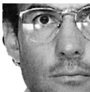
di Marco Pastonesi